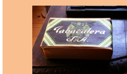
Tabaco de liar

2. Es un recipiente para transportar y guardar leche. Este concretamente, lo usaban las señoras que vendían leche por las casas